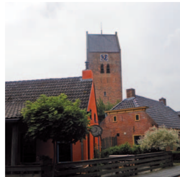
Restaurant in dorpsgezicht Oldehove

Van aandachtspunt, naar actiepunt en aan de slag dus! Afhankelijk van het onderwerp kunnen bijvoorbeeld gemeente, ondernemersorganisaties, plattelandshuizen of Groninger Dorpen daarbij ondersteuning bieden.