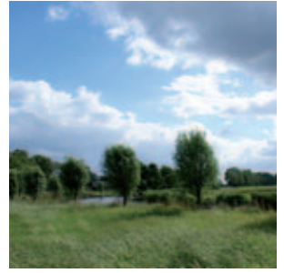
Uitzicht in de omgeving van het Dwarsdiep, Lucaswolde