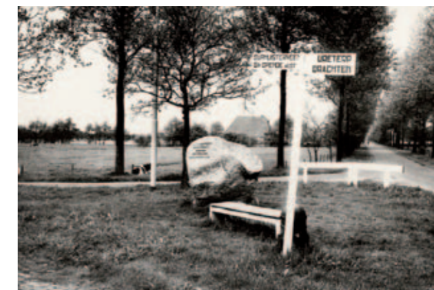
Leidijk in 1972, bij het zgn. vijf-gemeenten-punt