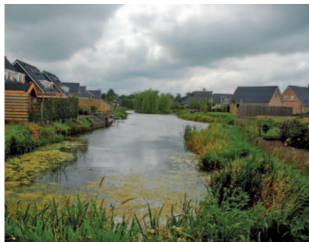
Waterpartijen in Plan De Wilpstervaart

De Wilp ligt in de gemeente Marum. Het dorp werd gesticht door Friese veenarbeiders en telt vandaag de dag een kleine 1700 inwoners. De naam van het dorp komt van de weidevogel de wulp maar dan uitgesproken op z'n Fries. Per slot van rekening ligt De Wilp op de grens met Friesland.