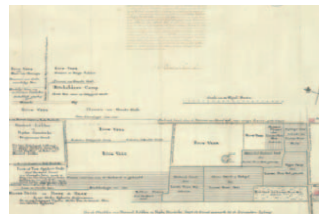
Veldnaam Pottebakkers camp, op kaart Lucaswolde uit 1810

Nadere informatie vindt u op WWW.VELDNAMENWESTERKWARTIER.NL en op HTTPS://FACEBOOK.COM/GRONINGERARCHIEVENDEVERDIEPING U kunt ook mailen: verdieping@groningerarchieven.nl