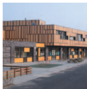
Brede school Nuis Niebert