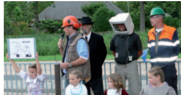
Feestelijke presentatie dorpsvisie Jonkersvaart