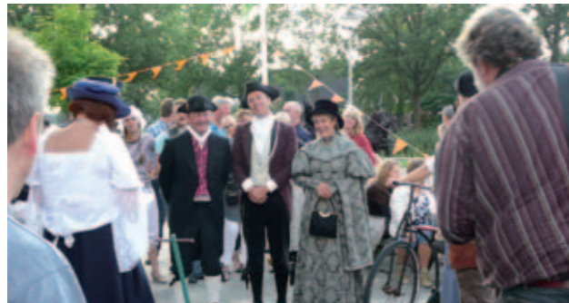
Feestelijke presentatie dorpsvisie Jonkersvaart