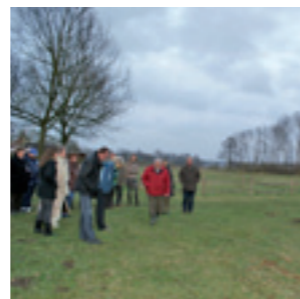
Het Eetbare Dorp