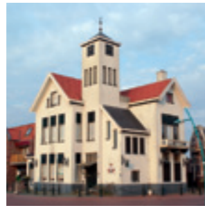
Voormalig gemeentehuis Uithuizermeeden