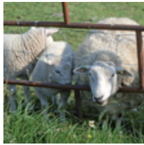
Schapen in de Eemshaven