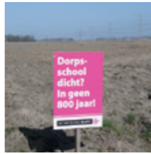
Actie Abt Emo school Blijft