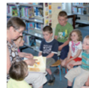
40-jarig bestaan dorpshuis Agricola, Baflo