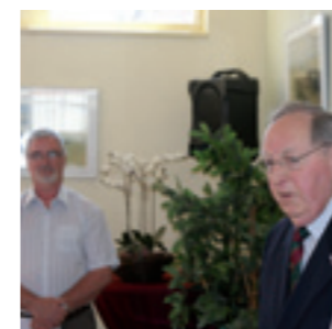
40-jarig bestaan dorpshuis Agricola, Baflo

Een C2C dorpshuis in Groningen bouwen? Bel 050 306 2900.