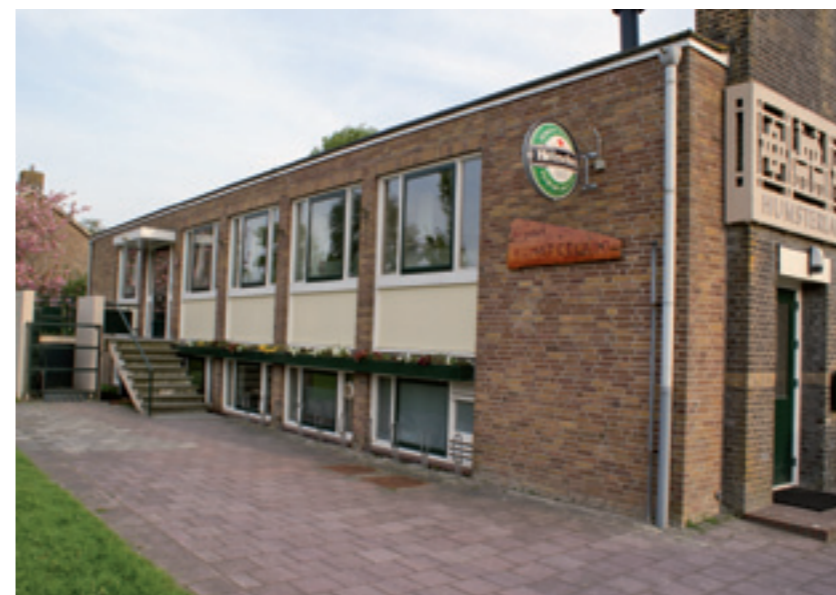
Dorpshuis Humsterland, Oldehove