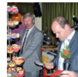
Heropening dorpshuis Tonedigo, Hellum