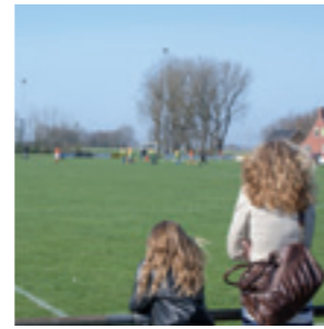
vv De Fivel, Zeerijp